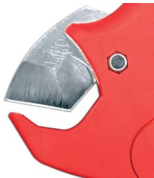
Geometría de precisión Precise geometry Géométrie de précision

Pour ces raisons, il fut récompensé de la Médaille d'Argent , au Salon International de l'Innovation, Concours Lépine, Paris, mai 2004.