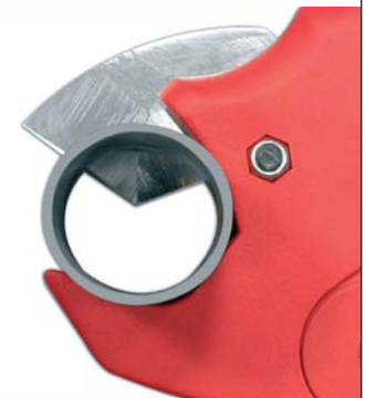
PVC rígido Rigid PVC PVC rigide