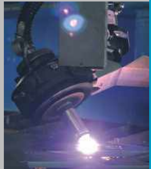
Plasma Fasenschneidaggregat Skew Axis Rotator \Delta für automatische Konturschnitte Plasma bevel cutting head Skew Axis Rotator \Delta for automatic contour bevel cuts