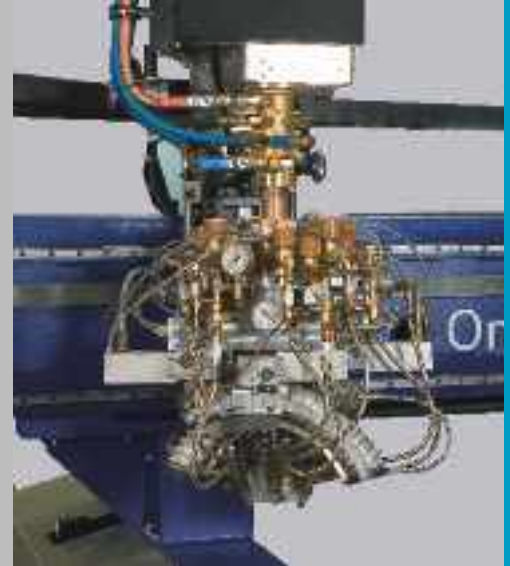
Vollautomatisches, unendlich drehbares Dreibrenneraggregat DAFL für das Autogen-Fasenschneiden an Konturen Fully automatic, infinitely rotating oxyfuel multi torch bevel cutting head DAFL